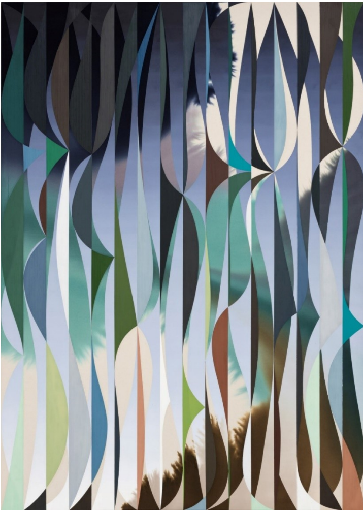
Giacomo Santiago Rogado, Accord , 2019, Mischtechnik auf Baumwolle, 280 x 220 cm