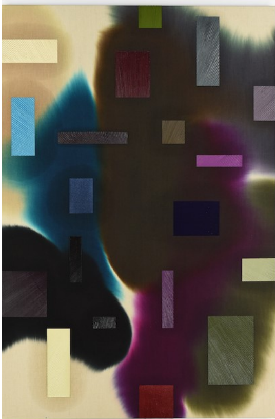
Giacomo Santiago Rogado, Tendo , 2018, Mixed media auf Hanf, 180 x 120 cm