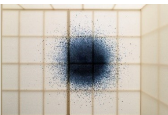
Giacomo Santiago Rogado, Growing together through emotions over time , 2017