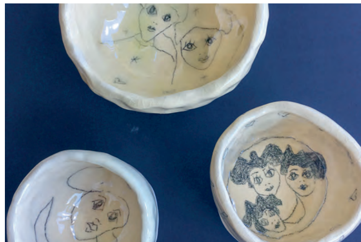
Constantin Brâncuși: «Die Dinge sind nicht schwer herzustellen, aber es ist schwierig, sich in den Zustand zu versetzen, sie zu machen.» (zitiert in Virot 1988)