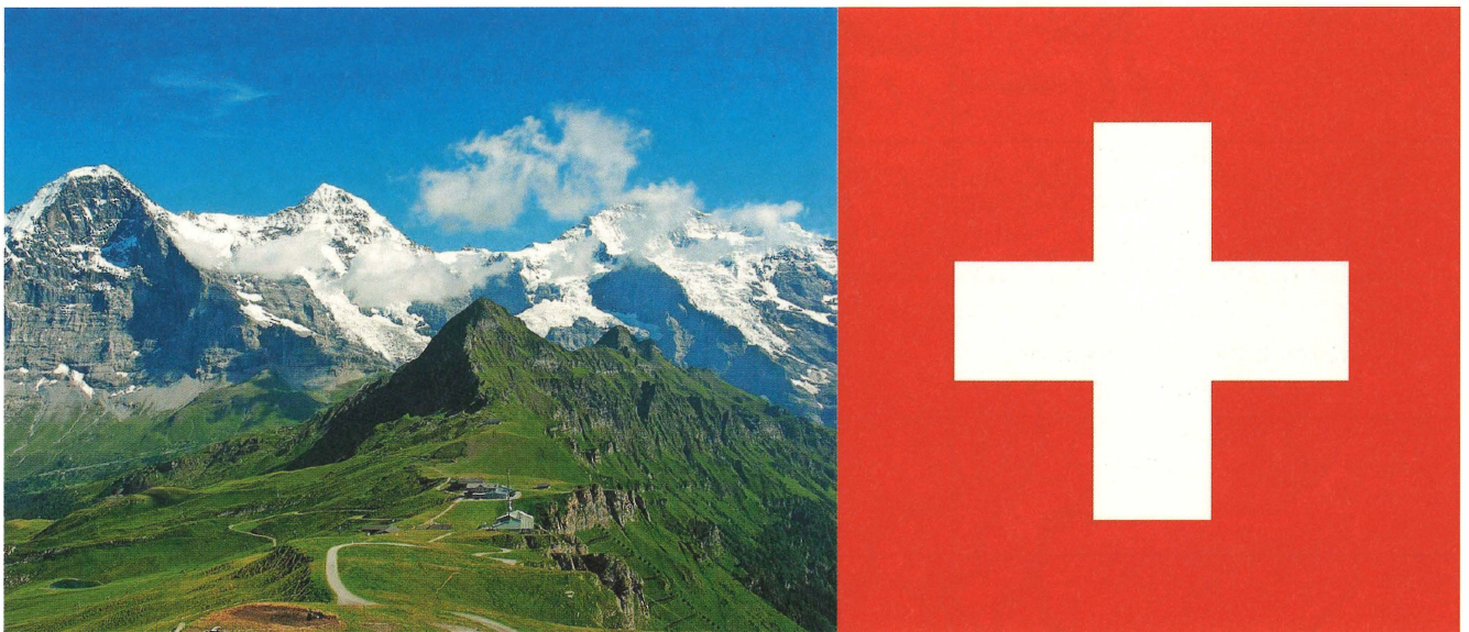
Eiger, Mönch und Jungfrau zählen seit 2001 zum Schweizer UNESCO-Weltnaturerbe

Die UNESCO ist eine internationale Sonderorganisation der Vereinten Nationen mit derzeit 193 Mitgliedsländern, die sich um die weltweite Förderung von Bildung, Wissenschaft und Kultur verdient macht. Sie wurde am 16. November 1945 mit zu Beginn 37 Staaten in London gegründet, ihr erster Generaldirektor war der Engländer Julian Huxley. Carina Seraphin