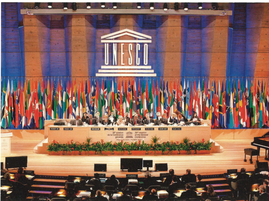
Das Podium bei der 36. Generalkonferenz der Unesco in Paris.