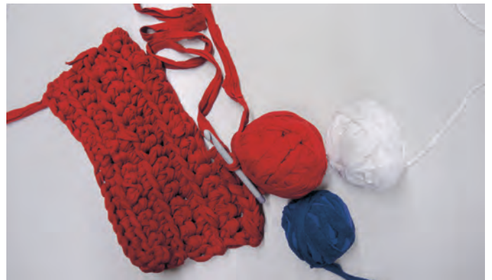
Erneute Fläche aus aufgetrennten Streifen