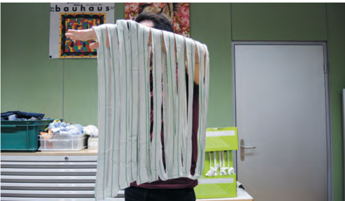
Möglichst lange Stoffstreifen