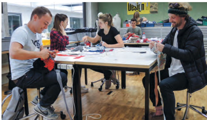
Häkeln als kollektives Flow-Erlebnis