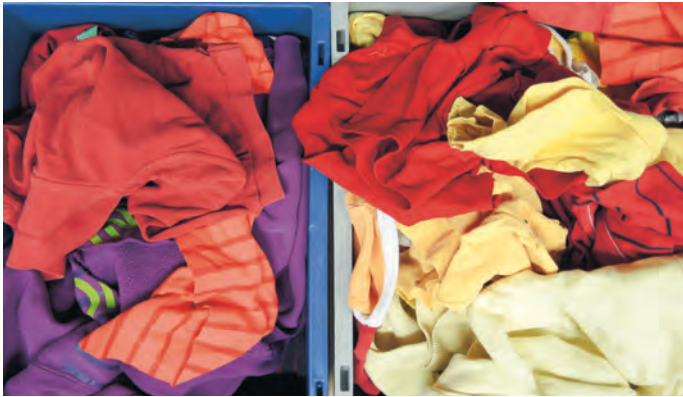
Ausrangierte Textilien für das Upcycling