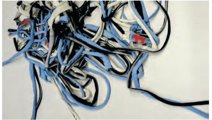
Garnproduktion aus T-Shirts