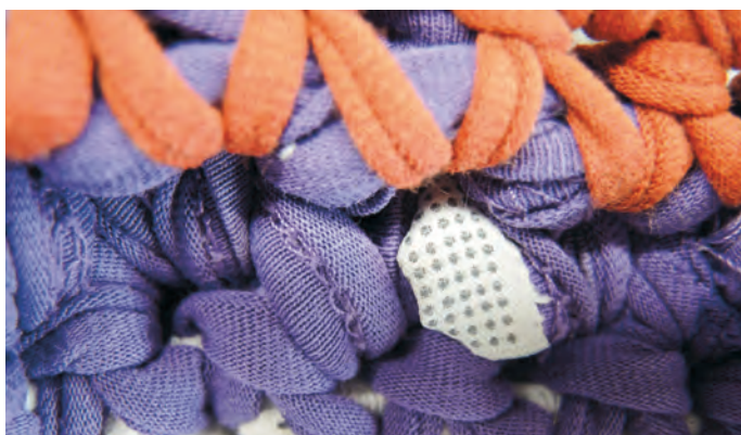
Verschiedenartige Farb- und Strukturwirkungen