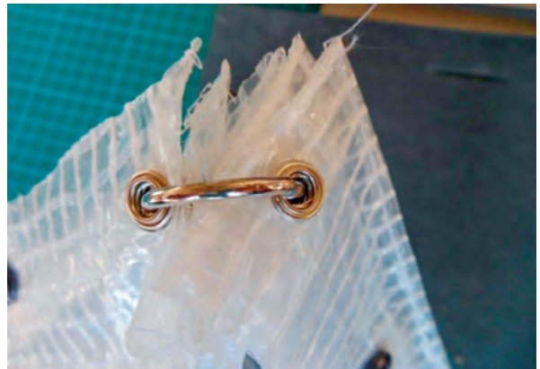
Verschiedene Verschlussmöglichkeiten werden erarbeitet.