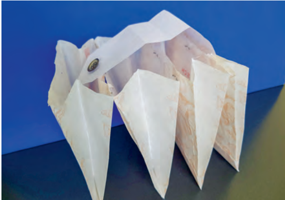
Erste Experimente werden mit Falttüten aus Papier gemacht.