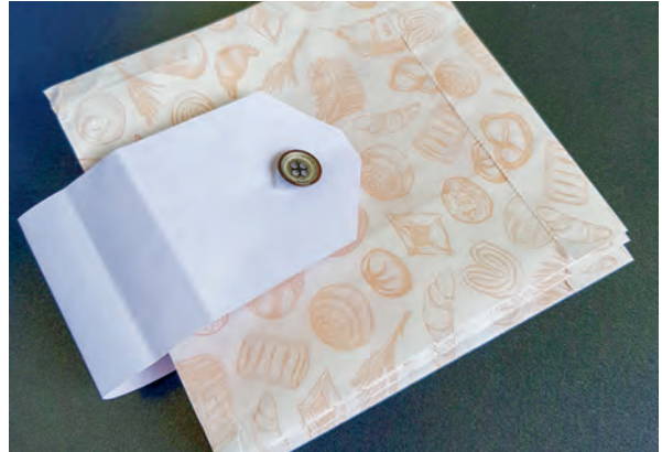
Mithilfe von Stufengängen werden verschiedene Verschlüsse erarbeitet.