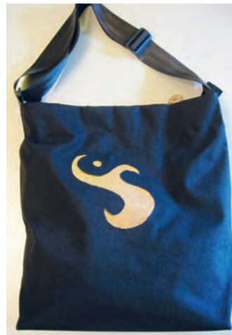
Studierende im Studiengang Primarstufe an der PHZ Luzern integrieren ausgewählte Ornamente in ihre Produkte.