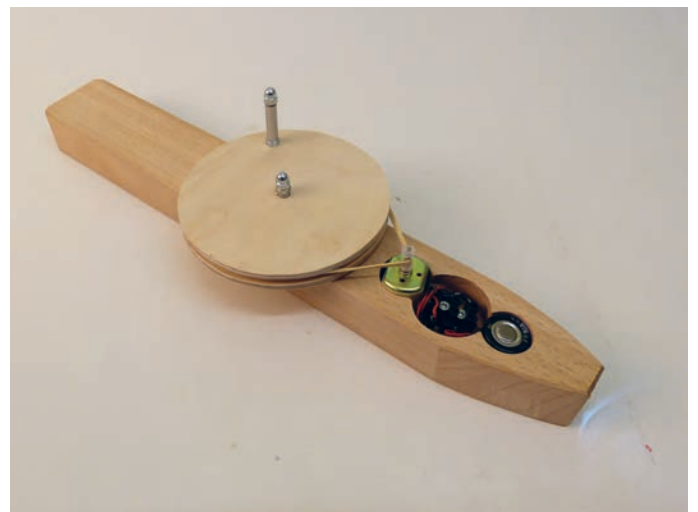
Übersetzung des Handantriebs über eine Riemenscheibe – links die Lampe ohne Gehäuse, rechts verpackt im massiven Buchengehäuse.