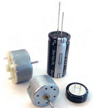
Solarmotoren und Kondensatoren