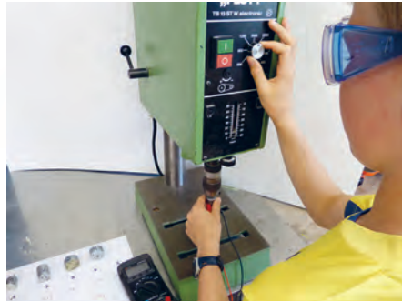
Wie viel Spannung wird erzeugt?