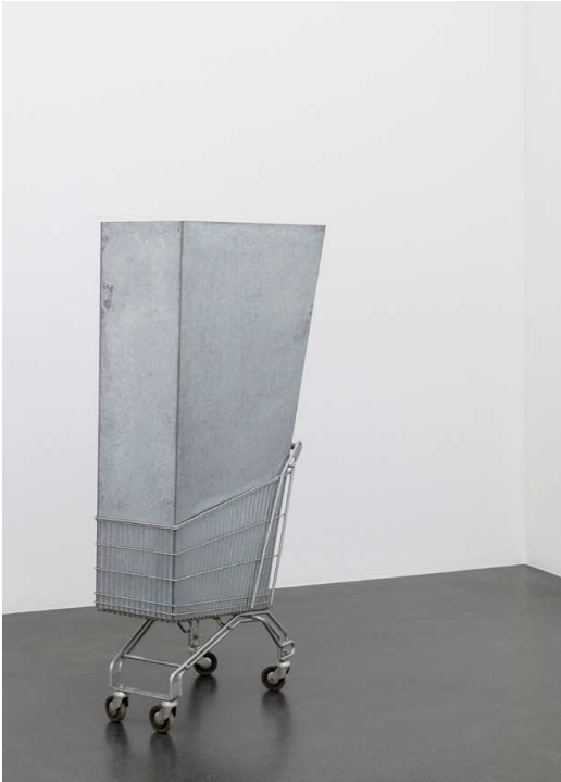
NAME DIFFUSION, Superart, 1988, Courtesy of the Artist and les Abattoirs, Musée - Frac Occitanie Toulouse