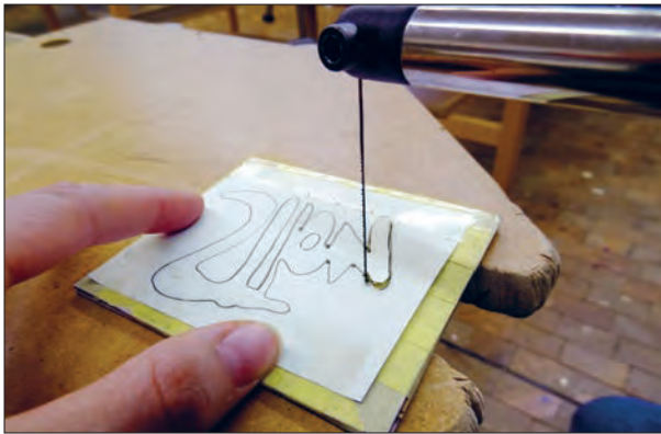
Notizblock – beim obersten Furnierblatt wird ein Schriftzug als Fenster ausgesägt (Furnier zwischen Kartons klemmen und mit Laubsäge aussägen).