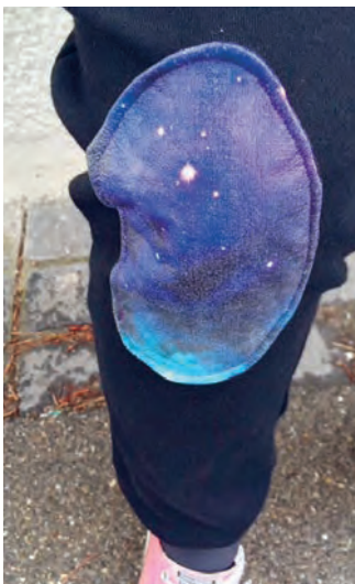
Galaxy-Wirkung durch Kombination von glänzend, glattem Polyacryl-Elastan-Mix mit matter Baumwolle sowie Kniepad mit Transferdruck des Moodbilds