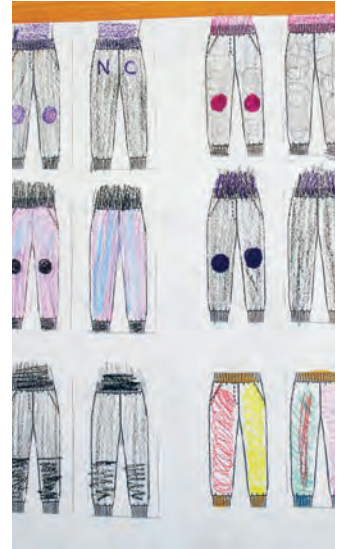
Zeichnung verschiedener Farbkombinationen für die Schnittteile