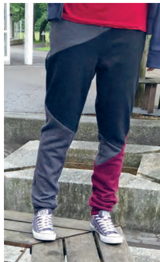
Die geometrische Musterung wird durch durchdachte Farbgebung sowie Schnittlinien, die diagonal über beide Beine geführt sind, geschaffen