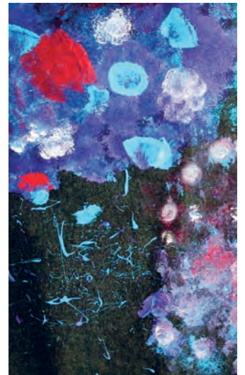
Versuch, Weltallstimung mit Textilfarben zu interpretieren